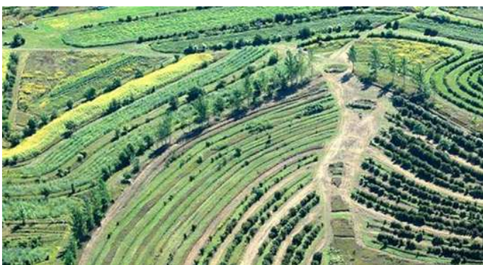
Abb. 3: Landschaft gestaltet nach dem Keyline-Design

Bei Starkregenereignissen sammelt sich das Wasser nicht in der Muldensohle, sondern kann breiter verteilt den Hang hinunterlaufen, wird abgebremst, kann dabei in den Boden eindringen und bewässert dadurch den ganzen Hang. Es wird mehr Wasser in der Fläche gespeichert. Die Landschaft dient also als großer Wasserrückhaltespeicher.