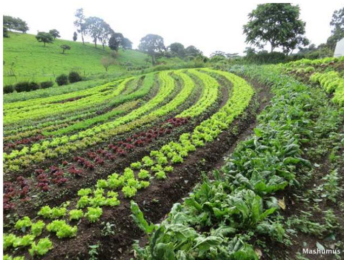
Abb. 5: Gemüsebau nach dem Keyline-Prinzip

Zum Führen des Wassers im Keyline-Design können aber auch Beete und Landschaftselemente dienen. Zäune mit Bewuchs am unteren Teil, Hecken, Baumreihen und Gräben mit durchlässiger Sohle leiten auch das Wasser in die Breite.