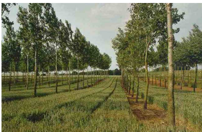
Abb. 6: Agroforstsystem, Getreidefeld mit Pappeln zur Biomasse-nutzung

Das Keyline-Konzept dient der ganzheitlichen Gestaltung von landwirtschaftlichen Betrieben. Dabei geht es davon aus, dass ganze Landstriche von einem Landwirt bewirtschaftet und nach Keylines designt werden können. Eine Kombination mit anderen Formen des Landbaus wie der Permakultur oder Agroforstsysteme ist möglich und auch sinnvoll.