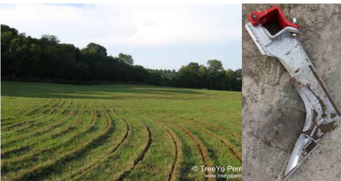
Abb. 4: Pflügen mit dem Keyline-Tiefenmeißel

Besonders geeignet ist diese Art der Hangbewirtschaftung auf Grün- und Weideland. Parallel zur Keyline lockert man den Boden bis in den Unterboden mit einem Tiefenlockerer, in dessen Furchen das Wasser dann auseinanderfließt und gut in den Unterboden infiltrieren kann. Das Wasser steht dann allen Teilen des Hangs gleichmäßiger zur Verfügung. Der Boden wird mit dem „Keyline-Tiefenmeißel“ nicht durchmischt, sondern nur tief gelockert. Yeomans geht auch davon aus, dass so langfristig Unterboden in fruchtbaren Oberboden umgewandelt wird.