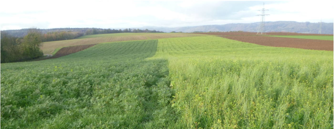
Abb. 1: Schlaggrößen in hügeligen Landschaften bei Fleisnitz

Wenn von Schlaggrößen in der Landwirtschaft die Rede ist, denkt man an die unterschiedlichen Agrarstrukturräume in Bayern und in Landstrichen Nord- und Ostdeutschlands.